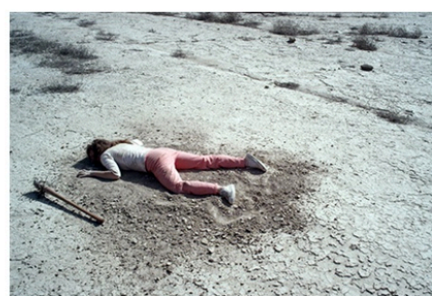
Piérdete entre los muertos México | 2018 | DCP | Color | 62 min | Ruben Gutierrez