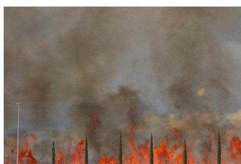
M México | 2018 | DCP | Color | 52 min | Eva Villaseñor