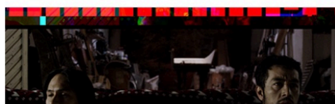
Los débiles México | 2017 | DCP | Color | 65 min | Raúl Rico, Eduardo Giralt Brun